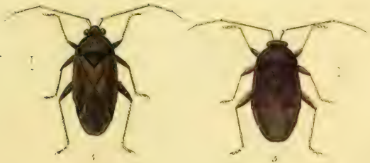
Fig. 1. Capsus arbustorum Fabr. 2 C. hortensis Meyer Fig. 3. C. brunnipennis Meyer 4. C. variabilis Hahn 5. C. modestus Meyer