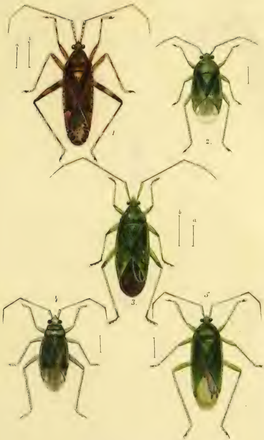
Fig. 1. Phytoecis divergens Meyer. - 2. Capsus Spinola Meyer. Fig. 3. C. pabulinus Lam. - 4. C. brevicollis Meyer. - 5. C. affinis H. C.