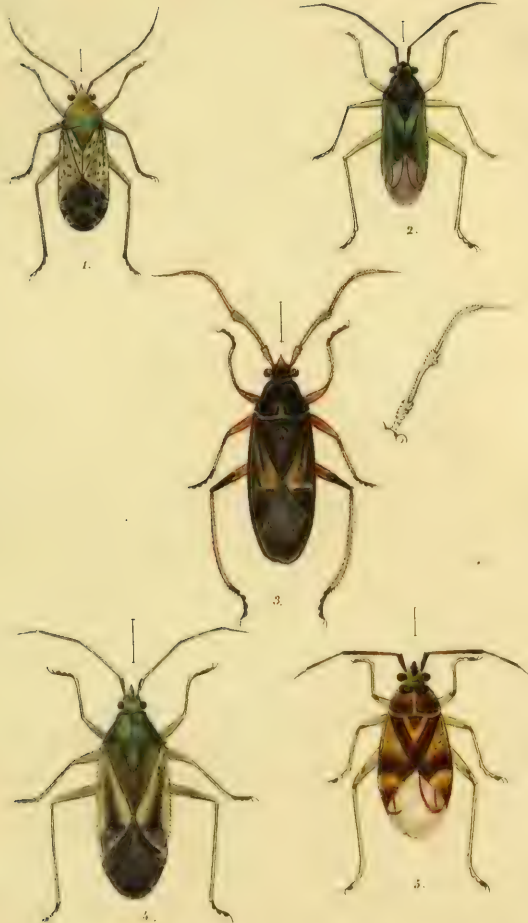
Fig. 1. Capsus maculipennis H.S. 2. C. elegantulus Meyer Fig. 3. C. curvipes Meyer. 4. C. solitarius Meyer 5. C. fasciatus Meyer