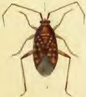
Fig. 1. Capsus verbasci H S 2. C. punctulatus Fall Fig. 3. C. atomarius Meyer 4. C. chorizans Fabr 5. C. coccineus Westerb