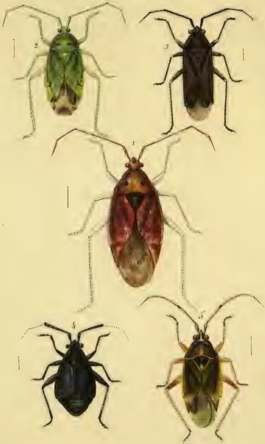
Fig. 1. Capsus teinensis Meyer. - 2. C. lucorum Meyer. Fig. 3. C. parallelus Meyer. - 4. C. nitidus Meyer. - 5. C. thoracicus Walker.