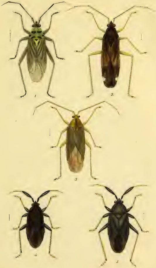
Fig. 1. Capsus setulosus HS. 2. C. avellanae Meyer Fig. 3. C. angustus HS? 4. C. Magnicornis Fall. 5. C. mali Mev.